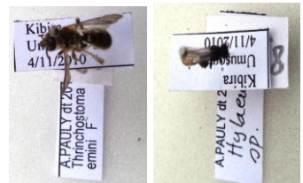
La Kibira abrite plusieurs espèces d'insectes pollinisateurs