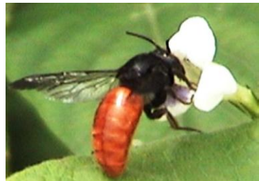
Plusieurs herbacées sont pollinisées par des insectes variés

L'espace agricole n'est pas le seul à dépendre des pollinisateurs. En effet, nombreuses plantes des milieux naturels nécessitent une pollinisation par les insectes pour se maintenir. Par conséquent, il est urgent de favoriser le maintien et le développement de beaucoup des pollinisateurs afin de soutenir non seulement l'agriculture, mais aussi beaucoup des plantes naturelles qui sont les grands éléments constitutifs d'une forêt.