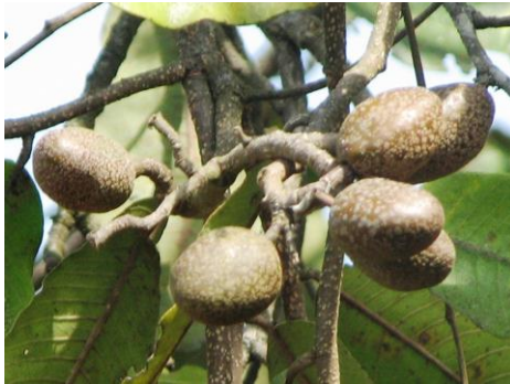
Parinari curatellifolia (Umunazi) dépend de la pollinisation

L'espace agricole n'est pas le seul à dépendre des pollinisateurs. En effet, nombreuses plantes des milieux naturels nécessitent une pollinisation par les insectes pour se maintenir. Par conséquent, il est urgent de favoriser le maintien et le développement de beaucoup des pollinisateurs afin de soutenir non seulement l'agriculture, mais aussi beaucoup des plantes naturelles qui sont les grands éléments constitutifs d'une forêt.