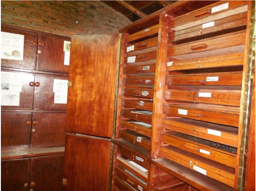
Armoires de conservation des insectes pollinisateurs à l'OBPE

Actuellement, 107 espèces d'abeilles ont été collectées et déterminées dans différents milieux du Burundi et sont conservées au Laboratoire de Recherche en Biodiversité à l'Office Burundais pour la Protection de l'Environnement (OBPE).