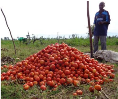
Les fruits de tomates issus du service de pollinisation

En agriculture, la contribution des abeilles est considérable sur les rendements quantitatifs mais aussi qualitatifs de très nombreuses cultures. Il est estimé que 1/3 de la production alimentaire d'une nation dépend directement de la pollinisation.