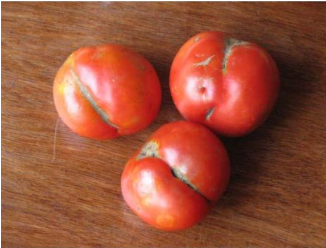
Tomates dont la pollinisation n'était pas complète : déformation longitudinalement orientée

En cas de mauvaise pollinisation, la qualité des fruits n'est pas bonne car ils possèdent des malformations du fait que la pollinisation n'a pas été complète. On constate que certaines malformations sont orientées longitudinalement, traduisant que certaines parties de l'ovaire n'ont pas été pollinisées.