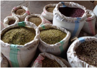
Les graines de haricots issues du service des pollinisateurs