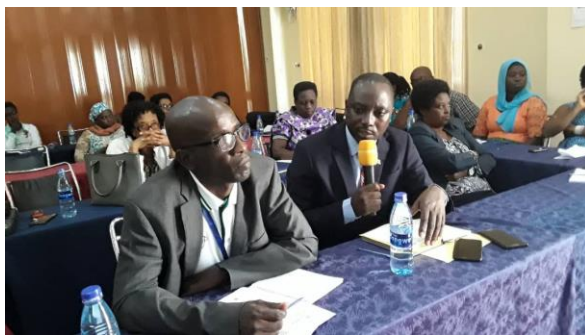
Figure 3 a: Intervention du DGOBPE

Les différentes interventions de la part des participants ( Figure 3 a & b ) ont constaté que le manque de guides touristiques outillés et qualifiés constitue une menace pour l'écotourisme au Burundi ; ils ont demandé s'il n'y a pas moyen d'importer des animaux exotiques pour enrichir les aires protégées du Burundi afin d'augmenter les produits touristiques. En réponse à cette dernière question, il a été dit qu'une étude préalable est nécessaire avant d'introduire des animaux étrangers.