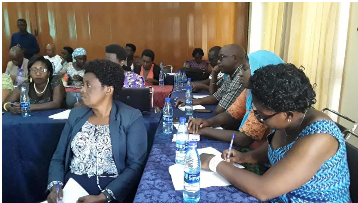
Figure 1: Vue des participants

49 participants dont le Directeur Général de l'Office National du Tourisme (ONT), le Directeur Général de l'Office Burundais pour la Protection de l'Environnement (OBPE), le Gestionnaire de l'Arboretum de Bujumbura, le Représentant du Chambre Sectoriel de l'Hôtellerie et du Tourisme, les Représentant des Hôtels, et les différents cadres du Ministère de l'Environnement, de l'Agriculture et de l'Elevage , les journalistes des radios locaux ainsi que les cadres de l'OBPE et de l'ONT.