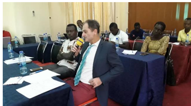
Figure 3 b: Intervention du Gestionnaire de l'arboretum de Kajaga