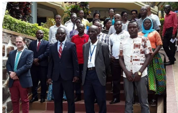
Figure 2 b: Photo de famille

Ensuite, les participants ont suivi une séance des présentations: