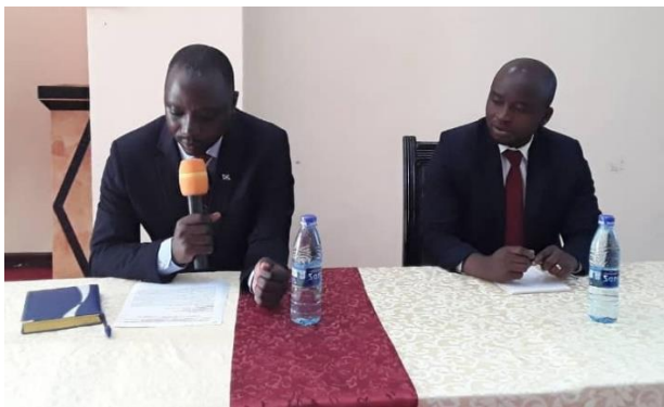
Figure 2 a: Mot d'ouverture par le DGOBPE

Après le mot d'ouverture prononcé par Monsieur le Directeur Général, une photo de famille a été prise (Figure 1 a & b).