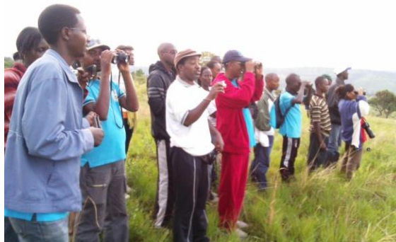
Abanyeshure bari mw'ishamba

I co mwomenya kandi, ikibanza gikingiwe ca Ruvubu kirafasha abanyeshure bariko baranonosora cane abari muri za Ico kibanza kandi ni bitandukanye na cane mu Burundi. Naho ibinyabuzima bitakiri kubera ibikorwa vyinshi nkengera yaco bagiye ya nyakanga yama yiha uguca ibiti n'amakara, hakoreshejwe uburozi n'amategeko, gutema