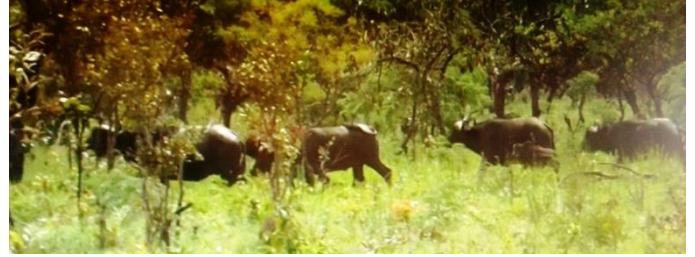
Ugwuri rw'imbogo mw'ishamba

Hambavu y'ibikoko, ishamba rya Ruvubu rigizwe hanini n'ivyatsi ivyo bikoko birisha hamwe rero n'ubwoko bw'inshi bw'ibiti bugizwe n'umunazi, umukambati, umusekera, umugoti, umusagamba, umushanga, ingogo n'ibindi vyinshi.