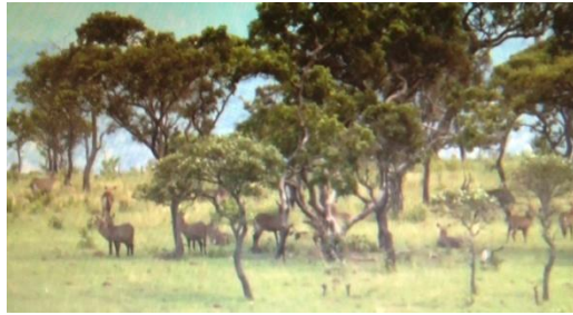
Ugwuri rw'indonyi mw'ishamba

w'ibiterwa kubera twa dukoko dutoduto tuguruka, gutanga akayaga keza, gikingira amasoko y'amazi n'isi biri muri iryo shamba n'ibindi.