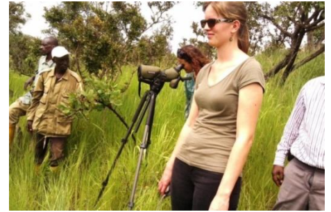
Ingenzi ziriko ziraba ibikoko

I vyo binyabuzima rero bifitiye akamaro kanini igihugu n'abakibamwo mu gukwegaga ingenzi, gukingira inkukura umwonga wa Ruvubu, kugwiza umwimbu