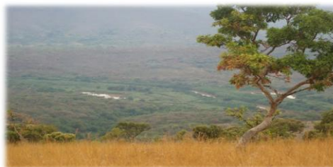
Vue de la vallée de la Ruvubu dans le PNRu à partir du site de Bibara, à Mutumba, Karuzi

savane), chutes de Gisuma, empilements granitiques ("kopjes") du piémont du Buyugoma, chutes de la Kayongozi, panoramas de la crête Muremera-Mvyeyi et de la falaise de Bibara ou encore le sud du parc au relief plus marqué et hébergeant des forêts denses ;