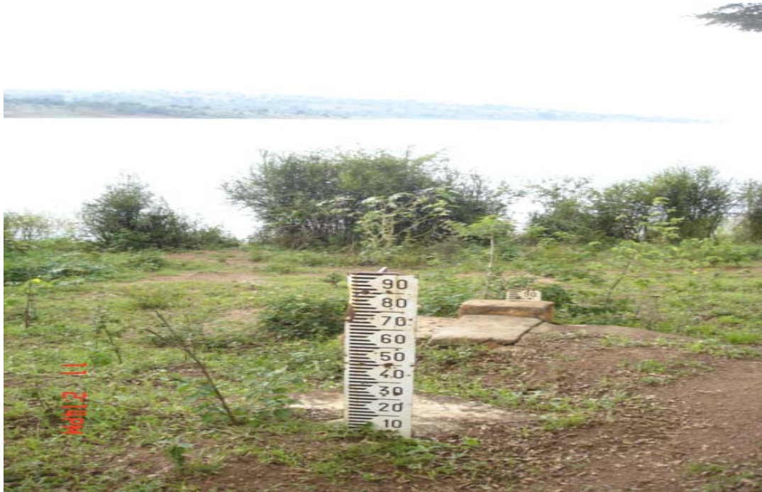
Photo n° 1: Photo sur le Lac COHOHA : Vue des échelles millimétriques qui étaient auparavant submergés et qui restent maintenant à découvert.

39. L'incidence des changements climatiques est sensible partout mais surtout dans les zones à pluviométrie faible et variable. Les régions naturelles, jadis considérées comme des greniers du pays (au Nord), connaissent actuellement un déficit hydrique entraînant des disettes chroniques.