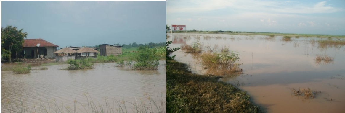
Photo 2 et 3 : Inondations dans la plaine de l'Imbo, près de l'Aéroport de Bujumbura.

dispositifs d'alerte précoce et de réduction des risques doivent être une réalité d'autant plus que de nombreux cours d'eau ont un régime torrentiel.