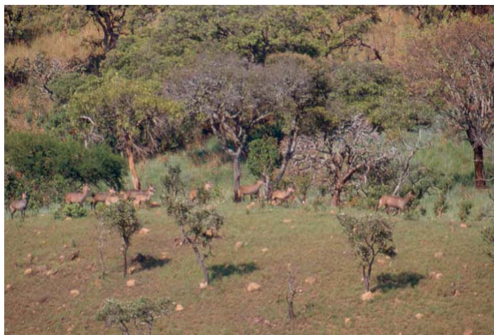
Photo 4: Observations des Cobes defassa du Parc National de la RUVUBU.

(ii) L'application du décret portant création des aires protégées et du décret sur la procédure des études d'impact environnemental et social, au vu de la croissance démographique qui constitue une menace sérieuse à la protection des aires protégées.