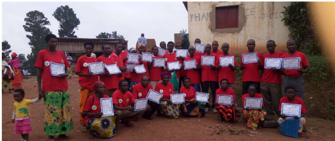
Figure 2: Graduation Day – Remise des certificats de formateurs PIP au Noyau G4 sur les collines d'extension en commune de Rugazi.

La mise à jour des PPIP concernait principalement les collines d'extension. Alors qu'on avait espéré que tout G4 formateur allait former 10 G5, on constate que chaque G4 a formé 8 G5 en moyenne. Dans ce cadre, 3 744 PPIP (dont 1 214 dans la zone d'action de ZOA et 2 530 dans la zone d'action d'Oxfam) ont été formés.