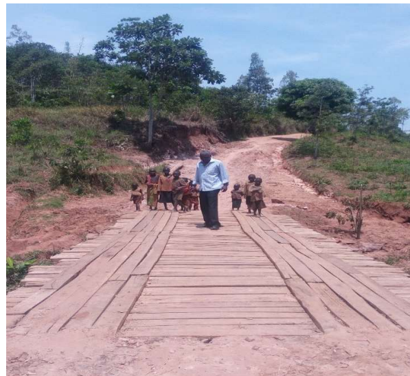
Figure 3: Un ponceau réhabilité sur la colline Canda en Commune Makamba dans le cadre de la mise en œuvre de la Vision Collinaire.

Avec la formation des PPIP de la 5 ème génération, l'année 2019 se termine avec un effectif total de 59 575 PPIP dont 34 626 femmes (58%) et 24 949 hommes (42%).