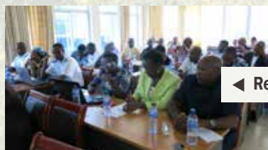
◀ Renforcement des capacités