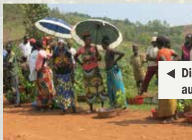
◀ Distribution des plants fruitiers aux ménages