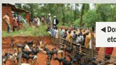
◀ Dons de chèvres à la communauté etc.