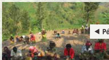
◀ Pépinière en développement