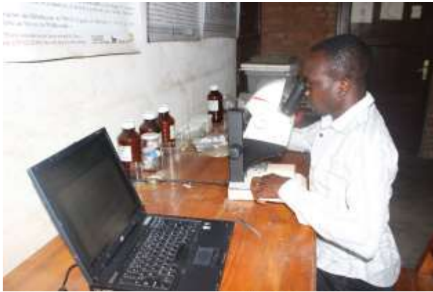
Figure 4: Identification des Syrphidae

Les spécimens de Syrphidae préparés ont été d'abord séparés selon leurs ressemblances morphologiques à l'aide d'un stéréomicroscope (figure 3). Certains ont été directement identifiés jusqu'au niveau de l'espèce, d'autres au niveau du genre en utilisant les clés d'identification des Syrphidae. La confirmation sera faite par les spécialistes lors de notre stage qui sera effectué à l'Institut Royal des Sciences Naturelles de Belgique (IRSNB) et au Musée Royal de l'Afrique Central (MRAC) en Belgique au mois d'Octobre 2021 où nous serons encadrés par Kurt Jordaens pour la formation en taxonomie et la détermination finale des espèces de Syrphidae.