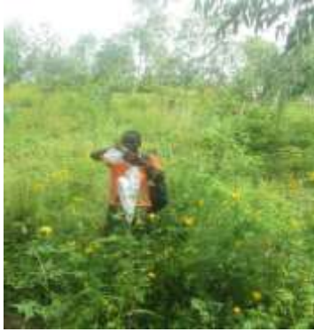
Figure 1 : Collecte des échantillons de Syrphes