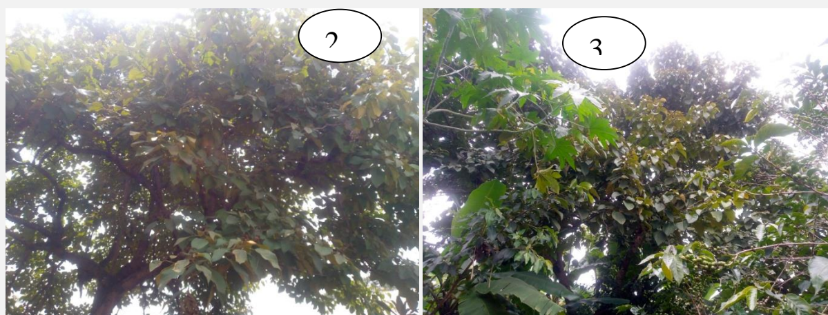
Photo2 : Pied du Cordia africana protège Comme symbole du Sanctuaire à Gishora