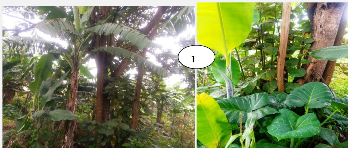
Photos1 : Pied du Cordia africana association avec les autres cultures