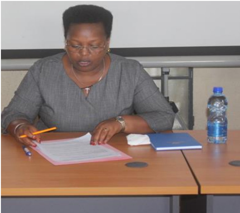
Mot d'ouverture de la directrice de l'environnement et changement Climatique représentante du DG de l'OBPE

Il a clôturé son mot d'ouverture en réitérant ses remerciements à toutes les parties prenantes qui reste constamment à notre cote pour appuyer notre pays en matière de la conservation de la biodiversité plus particulièrement l'IRSNB, à travers son programme CEBios et le centre d'échange d'information belge pour son soutien sans cesse manifesté pour appuyer les activités d'échange d'information et de gestion de la biodiversité du Burundi.