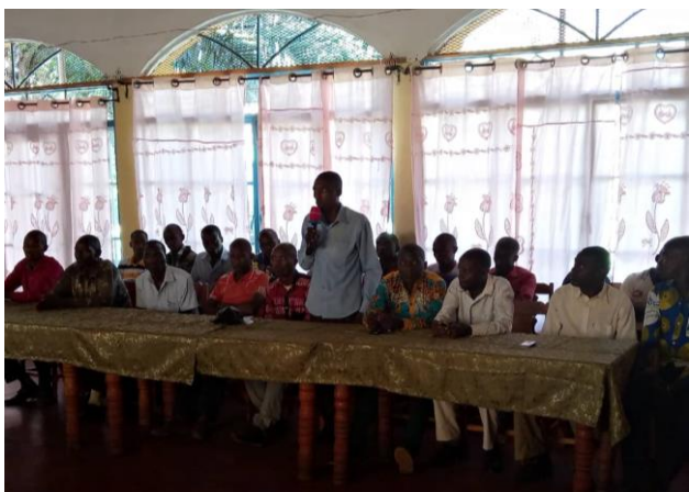
Intervention des participants