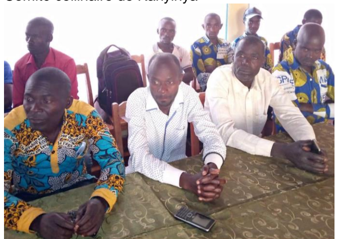
Vue partielle des participants