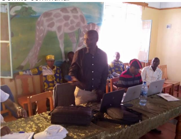
Intervention du Conservateur