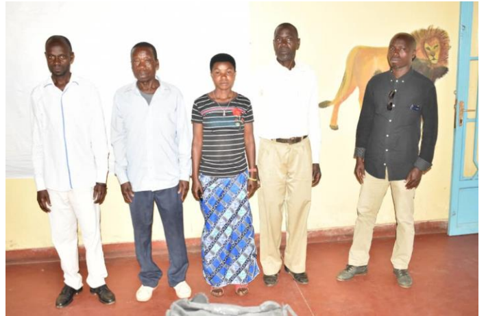
Comité collinaire de Kanyinya