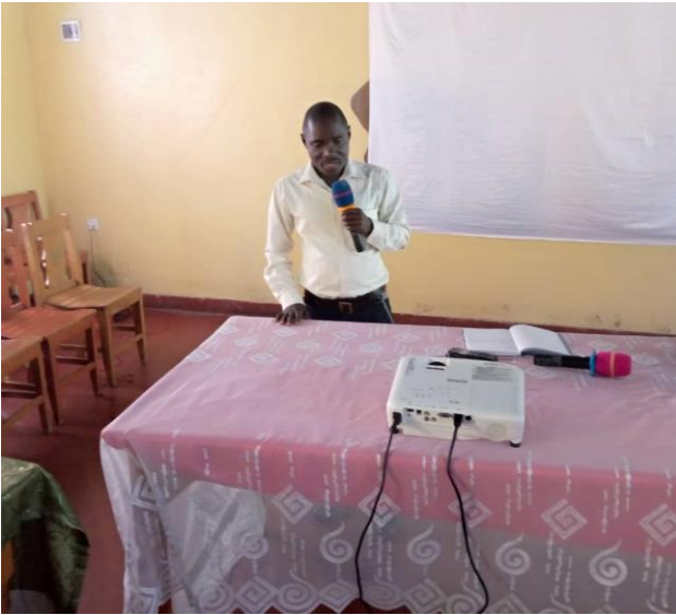
Présentation du programme par le Responsable technique du PAAPID