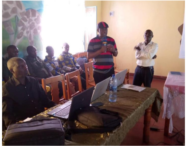
Intervention du présentateur