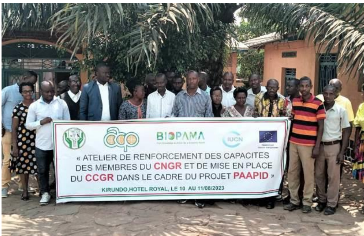
Photo de famille des participants à l'atelier

Le onzième jour du mois d'Août deux mille vingt-trois, s'est tenu un atelier de mise en place du Comité Communal de Gestion des Réclamations (CCGR) dans le cadre du Projet d'Appui à l'amélioration de l'efficacité de gestion du Paysage Aquatique Protégé du Nord et aux Initiatives de Développement Communautaire (PAAPID). Dans cette séance, était présent le Représentant du DG de l'OBPE, l'Administrateur de la commune Kirundo, le Chef d'antenne de l'OBPE à Kirundo, les cadres de l'OBPE, le Commissaire de la Police, le juge du tribunal de résidence communal, le Conservateur et gestionnaire du Lac Rwihinda, les chefs des collines surplombant le lac Rwihinga, les membres des comités d'appui à la gestion du Lac Rwihinda, les membres du CNGR, les responsables religieux et les représentants de la société civile.