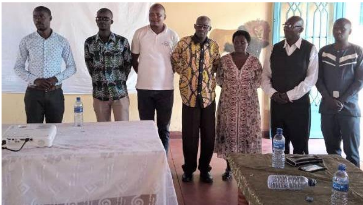
Photo Membres du Comité Communal de Gestion des Réclamations

Ainsi, 7 membres, dont 5 hommes, 1 femme et 1 jeune, ont été choisis. A son sein, on a choisi le Président et son Vice, le Secrétaire et 4 membres.