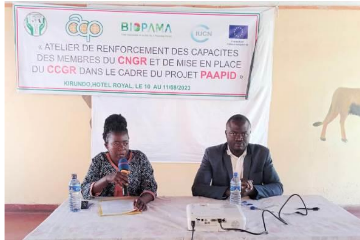
Photo mot d'ouverture par Madame le Directeur Administratif et Financier (OBPE).

Ainsi, trois niveaux de traitement des réclamations (MGRs) dont (i) du Comité de Médiation Communautaire (CMC), (ii) du Comité Communale de Gestion des Réclamations (CCGR) et (iii) du Comité National de Gestion des Réclamation (CNGR) sont prévus dans le cadre du présent projet.