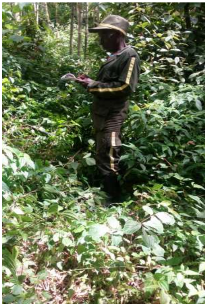
Collecte de données dans le quadrant de Musigati