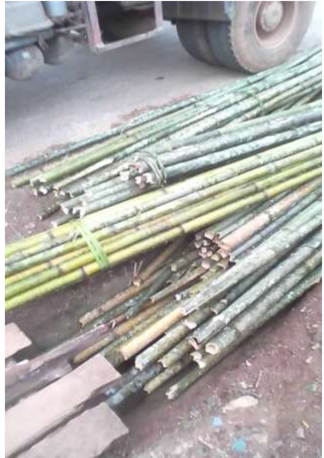
Une dizaine de fagots de bambous saisis par le chef de secteur Rwegura

Pour endiguer une telle situation, les gestionnaires de ce secteur au quotidien devraient prendre des stratégies de surveillance efficaces surtout en collaborant avec les forces de l'ordre basés au niveau du pont sur le lac de retenu de Rwegura. Cette surveillance se ferait surtout le soir où beaucoup d'individus, femmes et hommes confondus, transportent du bambou et du bois.