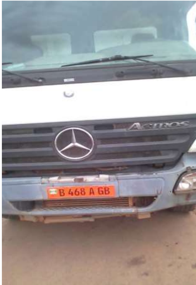
Camion de l'OTB prêt pour le transport de bambous