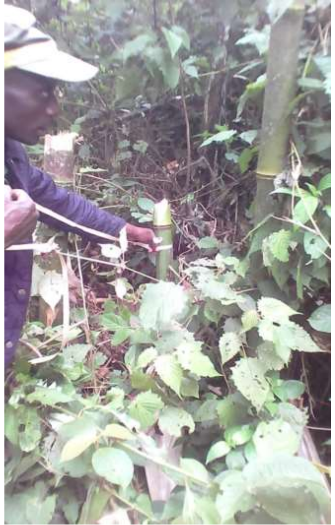
Collecte de données dans le quadrant de Rwegura