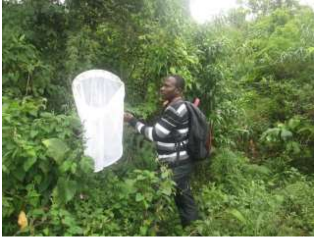
Figure 1 : Collecte des échantillons de Syrphes au PNK