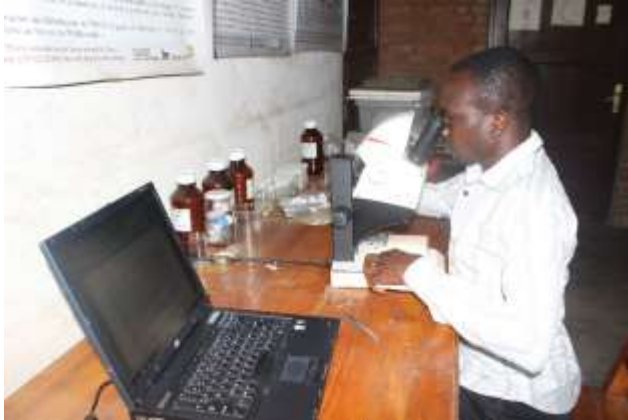
Figure 3: Identification des Syrphidae

Les spécimens de Syrphidae préparés ont été d'abord séparés selon leurs ressemblances morphologiques à l'aide d'un stéréomicroscope (figure 3). Certains ont été identifiés jusqu'au niveau de l'espèce, d'autres au niveau du genre en utilisant les clés d'identification des Syrphidae disponibles à l'OBPE.