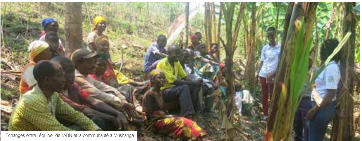
Echanges entre l'équipe de l'ABN et la communauté à Mushanga

climatiques. Toute la communauté de la place plaide pour la protection des autres collines escarpées qui restent assez nombreuses dans la contrée.