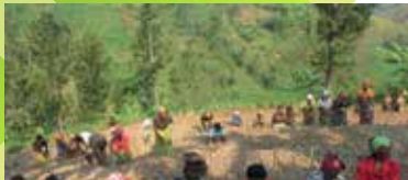
Pépinière en développement