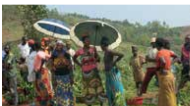
Distribution des plants fruitiers aux ménages