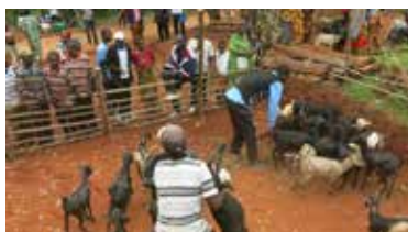
Dons de chèvres à la communauté etc.

Dans ses activités, l'ABN travaille avec ses partenaires gouvernementaux, locaux et internationaux pour la mise en place et la mise en œuvre des projets dans les différents domaines :