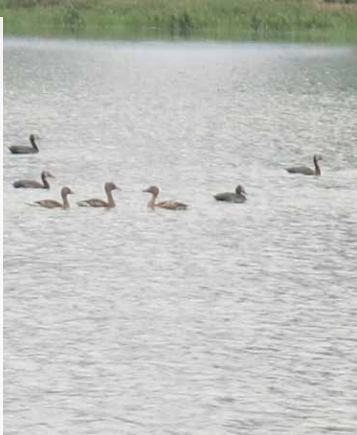
Les oiseaux nagent dans les eaux dans l'un des étangs du site d'épuration à Buterere

Le Représentant de l'ABN a terminé son allocution en encourageant les participants à rester actifs en prenant toujours part aux différentes activités qu'organise l'association malgré la pandémie du COVID-19.