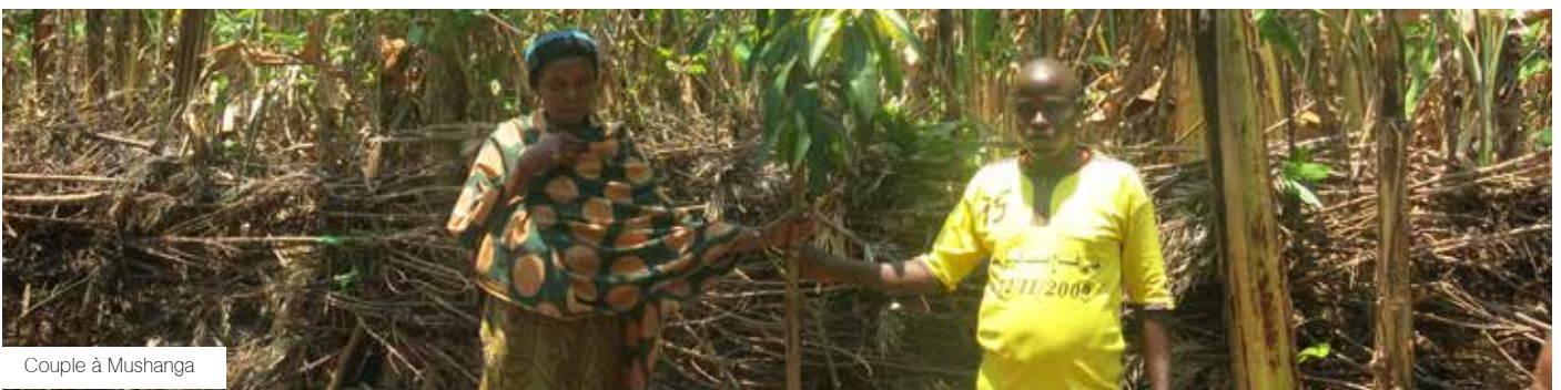
Couple à Mushanga

plantes agro forestières est estimé à 95%, alors qu'il est de 70% pour les plantes fruitières. Ce faible taux de survie des plantes fruitières est dû à la mauvaise adaptation des avocats.