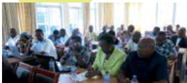
Renforcement des capacités