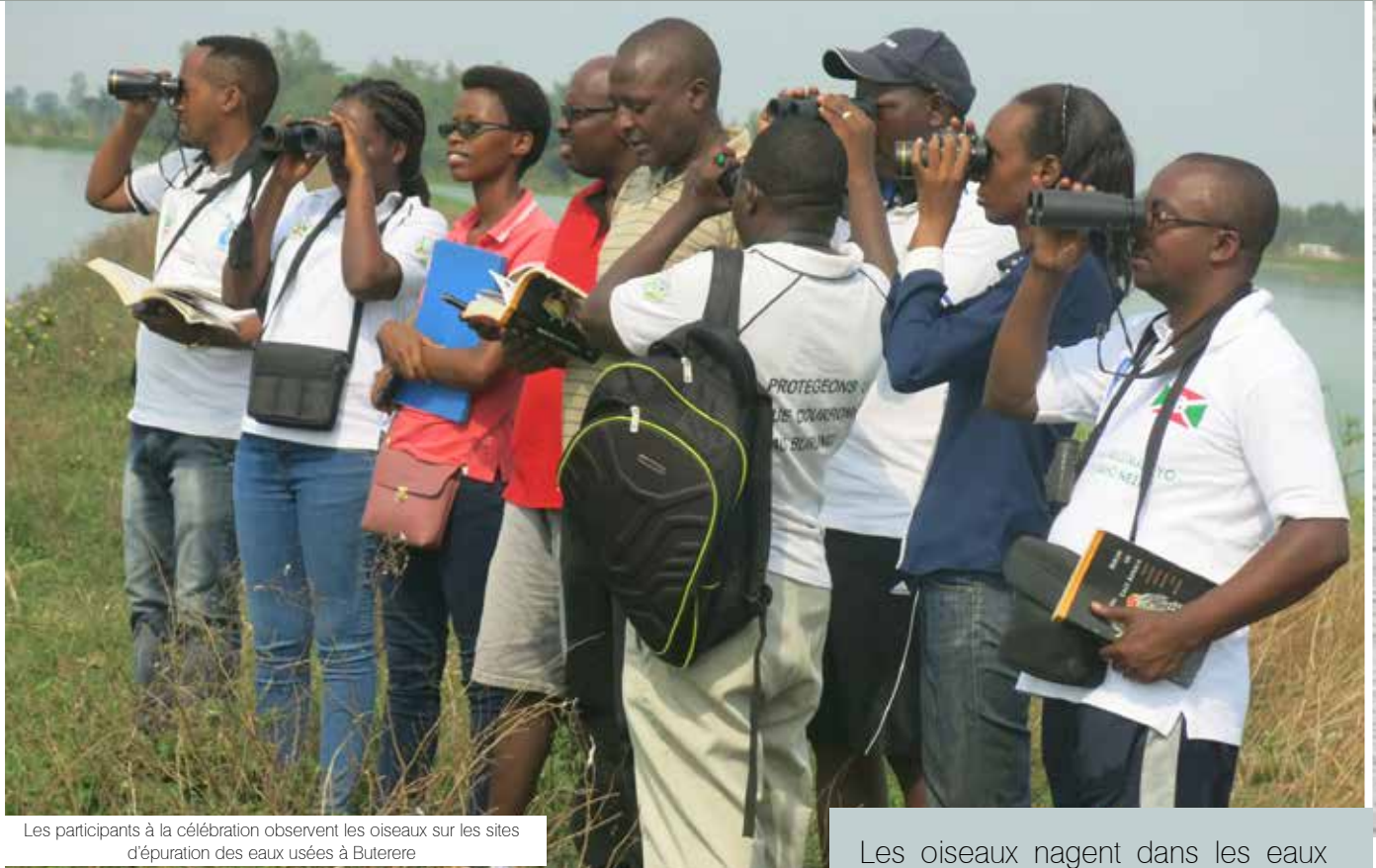
Les participants à la célébration observent les oiseaux sur les sites d'épuration des eaux usées à Buterere

Les oiseaux nagent dans les eaux dans l'un des étangs du site d'épuration à Buterere