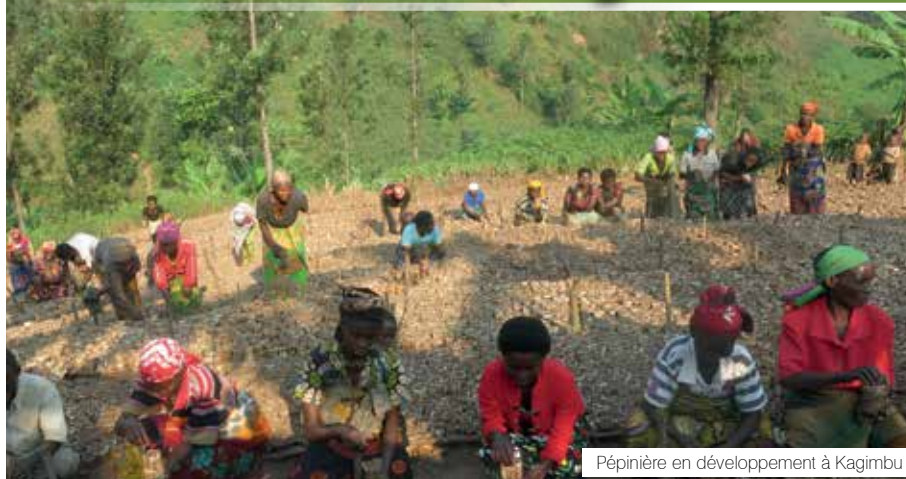
Pépinière en développement à Kagimbu

L'association Burundaise pour la protection de la nature a soufflé ses 20 bougies en Avril de cette année 2020.