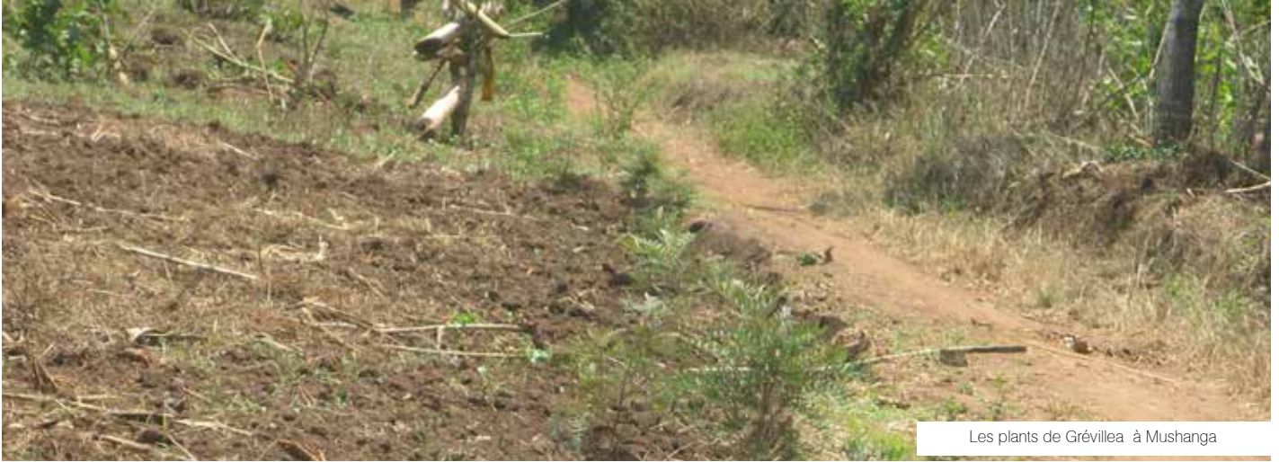
Les plants de Grévillea à Mushanga