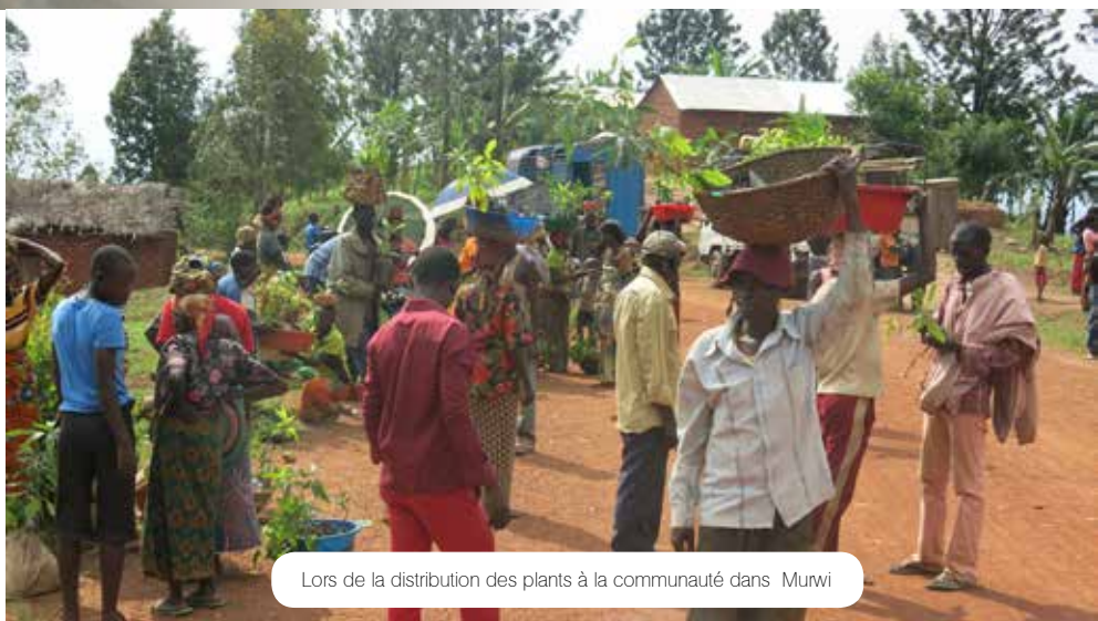
Lors de la distribution des plants à la communauté dans Murwi

de hauteur est en place. Les plants sont en très bon état sur toutes les collines reboisées. Les visites effectuées sur les sites des projets montrent que les activités réalisées dans les 2 communes ont couvert toute la zone du projet et au delà. Que ce