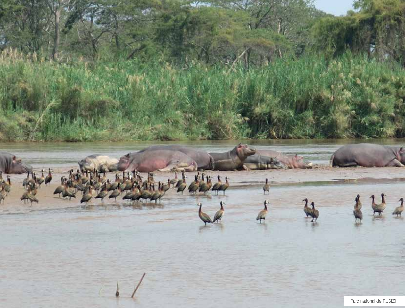
Parc national de RUSIZI